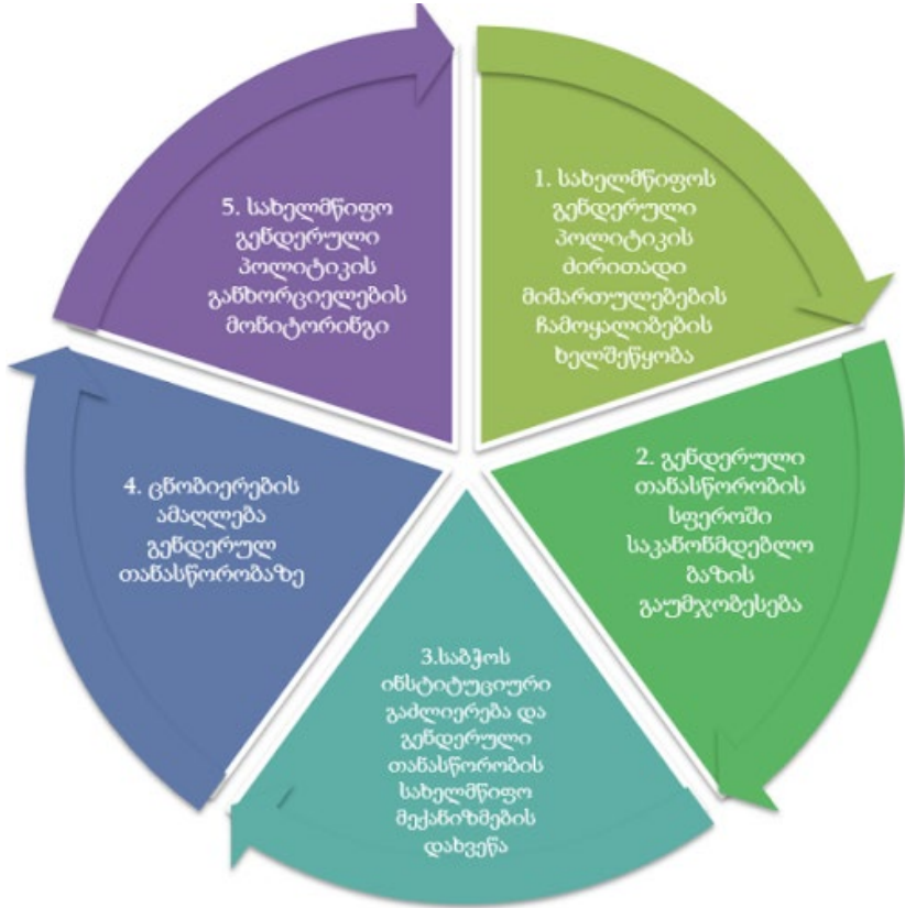
გრაფა 1: გენდერული თანასწორობის მუდმივმოქმედი საპარლამენტო საბჭოს საქმიანობის ძირითადი მიმართულებები 2022-2024 წლებისათვის

წყარო: გენდერული თანასწორობის საპარლამენტო საბჭოს სამოქმედო გეგმა 2022-2024